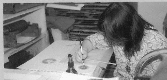
國立臺灣藝術學院版畫教室創作情形