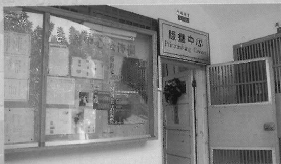
國立臺灣藝術學院版畫中心