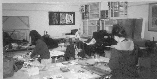
國立臺灣藝術學院版畫中心凸版教室（鍾有輝提供）