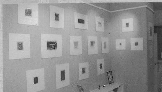
國立臺灣藝術學院版畫中心迷你畫廊